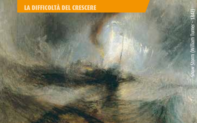
Snow Storm (William Turner - 1842)