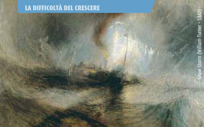
Snow Storm (William Turner - 1842)